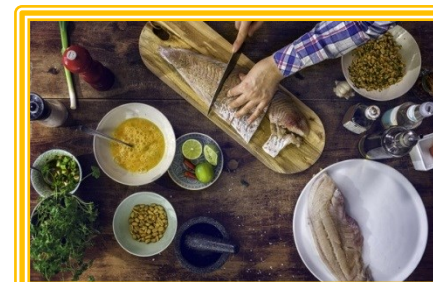
... CHE COSA CUCINARE.