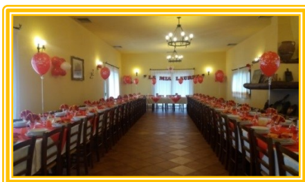
... DOVE FARE LA FESTA.