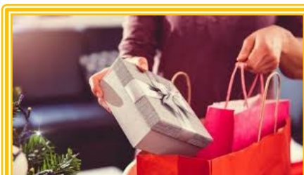
... CHE COSA REGALARE.